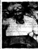
JUAN MANUEL FANGIO

LA HABANA, febrero 23. (U.P.) Juan Manuel Fangio, campeón mundial de automovilismo, fue secuestrado hoy por cuatro desconocidos. Los primeros informes dicen que un hombre alto y fornido, vestido con americana de cuero, subió hasta la habitación de Fangio, en el hotel Lincoln, situado en el centro de La Habana, y lo amenazó con una pistola. Los dos hombres en el ascensor e retiraron en un coche en el cual había tres individuos más. Se supo que la policía recibió la noticia de su desaparición sobre el particular y el hotel responde a todas las llamadas que se hacen a Fangio diciendo que "saló a dar un paseo".